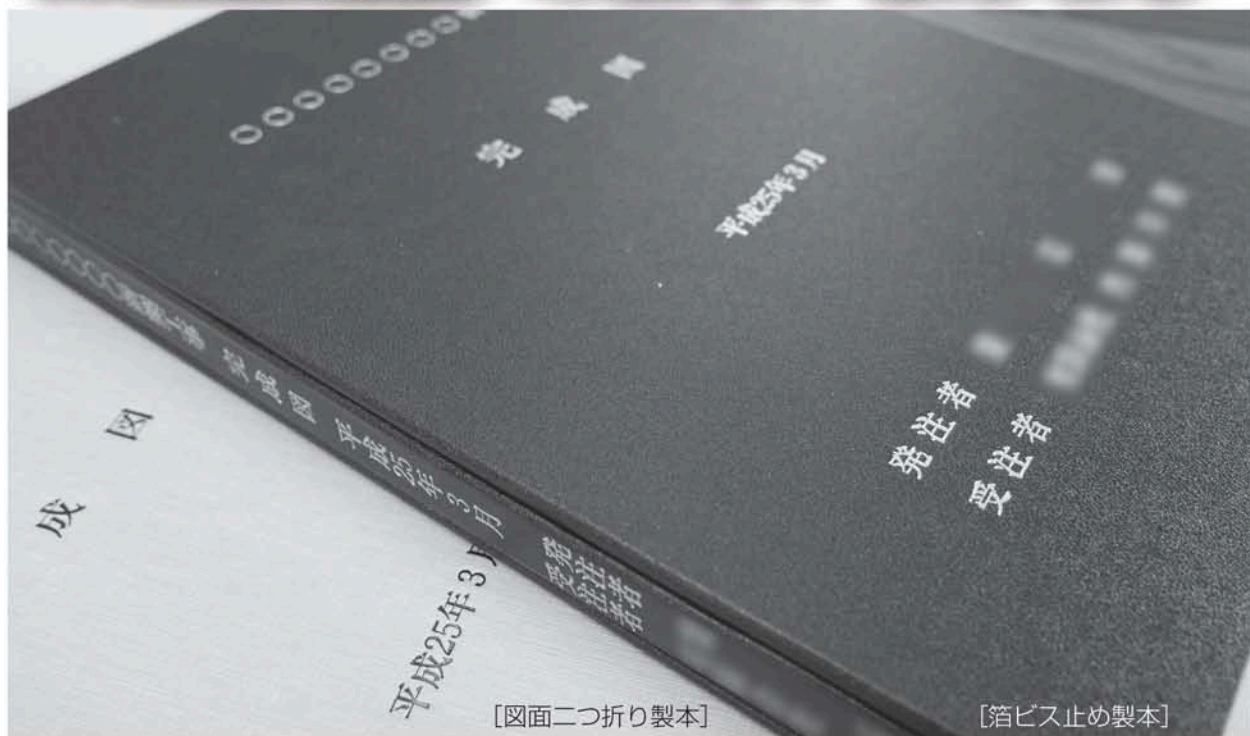
[図面二つ折り製本]